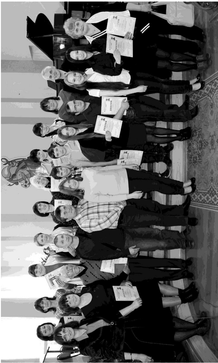
Победители XI конкурса