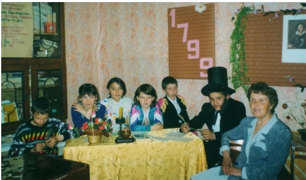
На фото: Вечер, посвященный 200-летию А. С. Пушкина. 1999 г.

работу с краеведческими документами: правильно их учитывать, хранить, систематизировать.