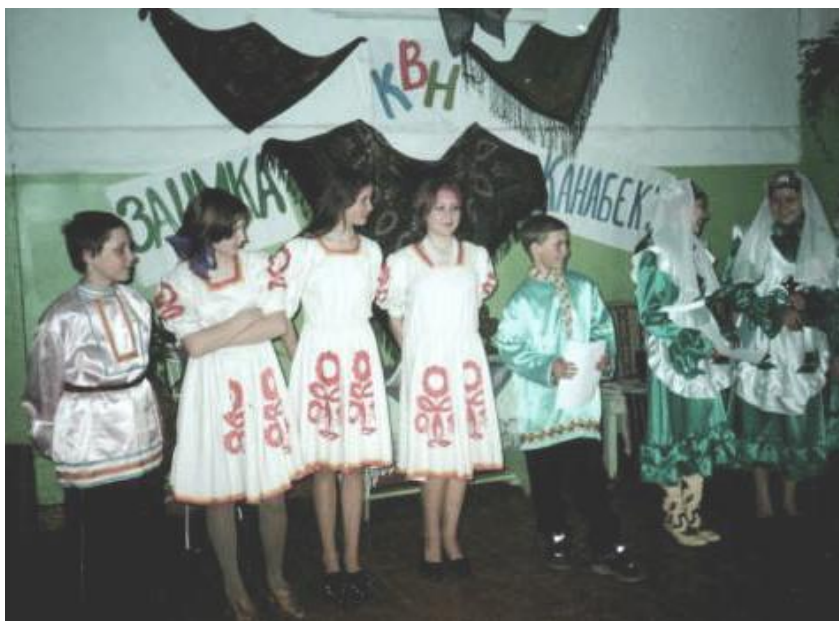
На фото: КВН между учащимися школ деревень Заимка и Канабеки. 2005 г.

В 1995 году к 50-летию Победы в Великой Отечественной войне оформлены альбомы «Наши воины-земляки на защите Отечества». По его материалам проведен вечер «Медаль за бой, медаль за труд из одного металла лют», устный