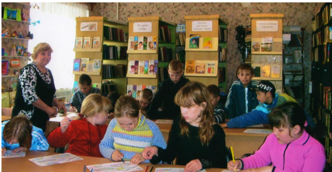
На фото: Пасхальные посиделки. 2011 г.