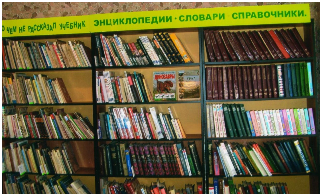
Справочный фонд библиотеки