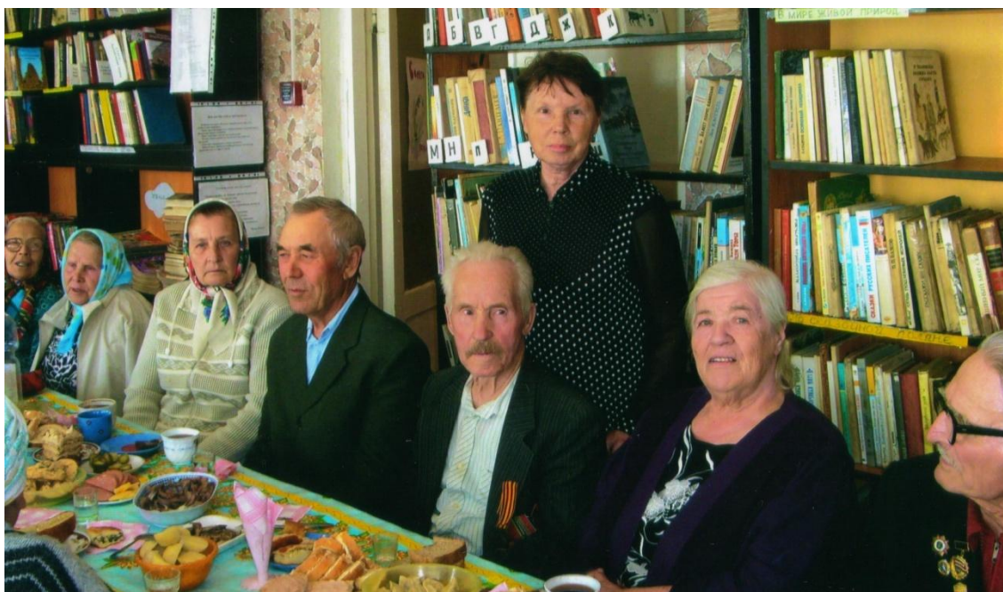
На фото: Вечер, посвященный Дню Победы. 2011 г.