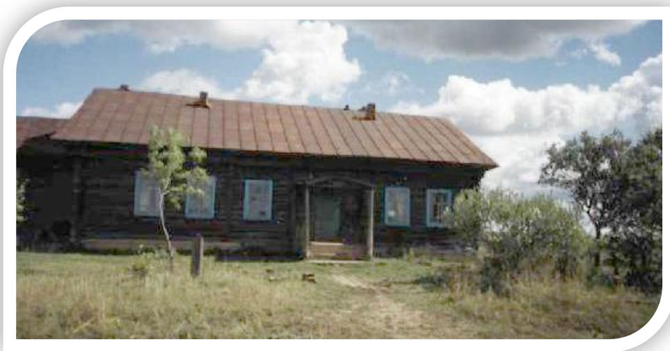
В настоящее время библиотека находится в здании клуба