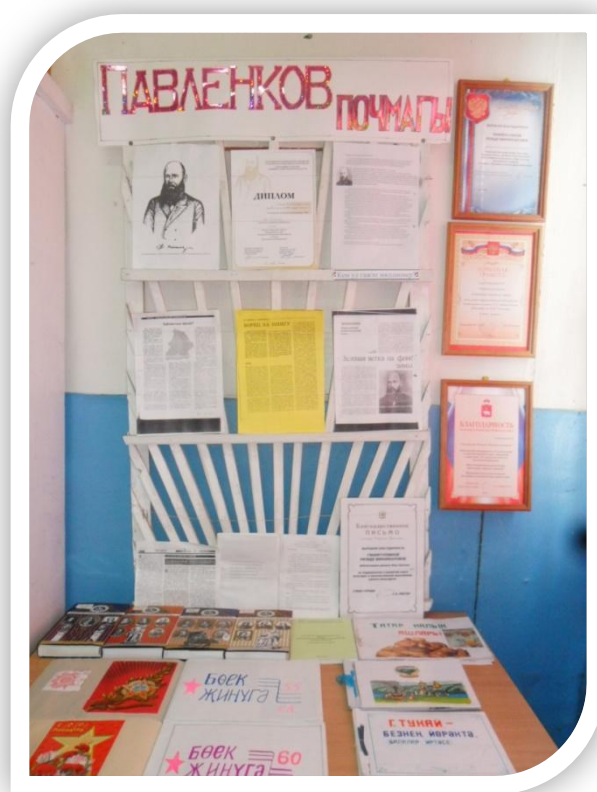
Стенд, посвященный Ф. Ф. Павленкову

В соответствии с ФЗ «Об общих принципах организации местного самоуправления в Российской Федерации» Верх-Култымская библиотека передана в Новорождественское сельское поселение. В 2012 году организовано муниципальное бюджетное учреждение культуры «Новорождественская поселенческая библиотека», получившее статус юридического лица. Верх-Култымская библиотека стала структурным подразделением этого учреждения.