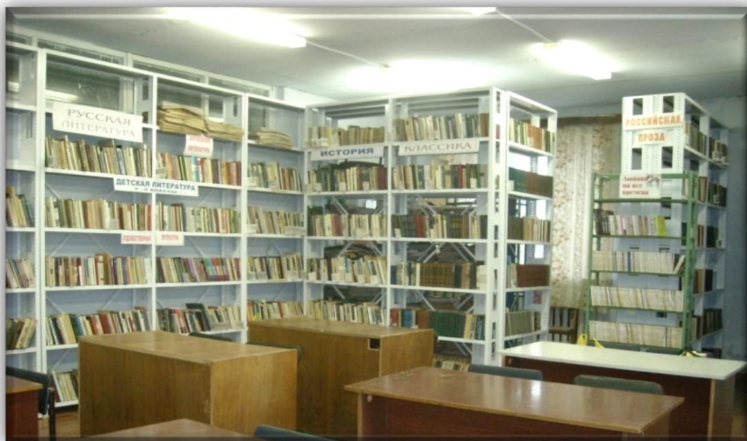
Новые стеллажи в библиотеке

Библиотека востребована читателями, которые приходят сюда не только за книгой, но и за советом.